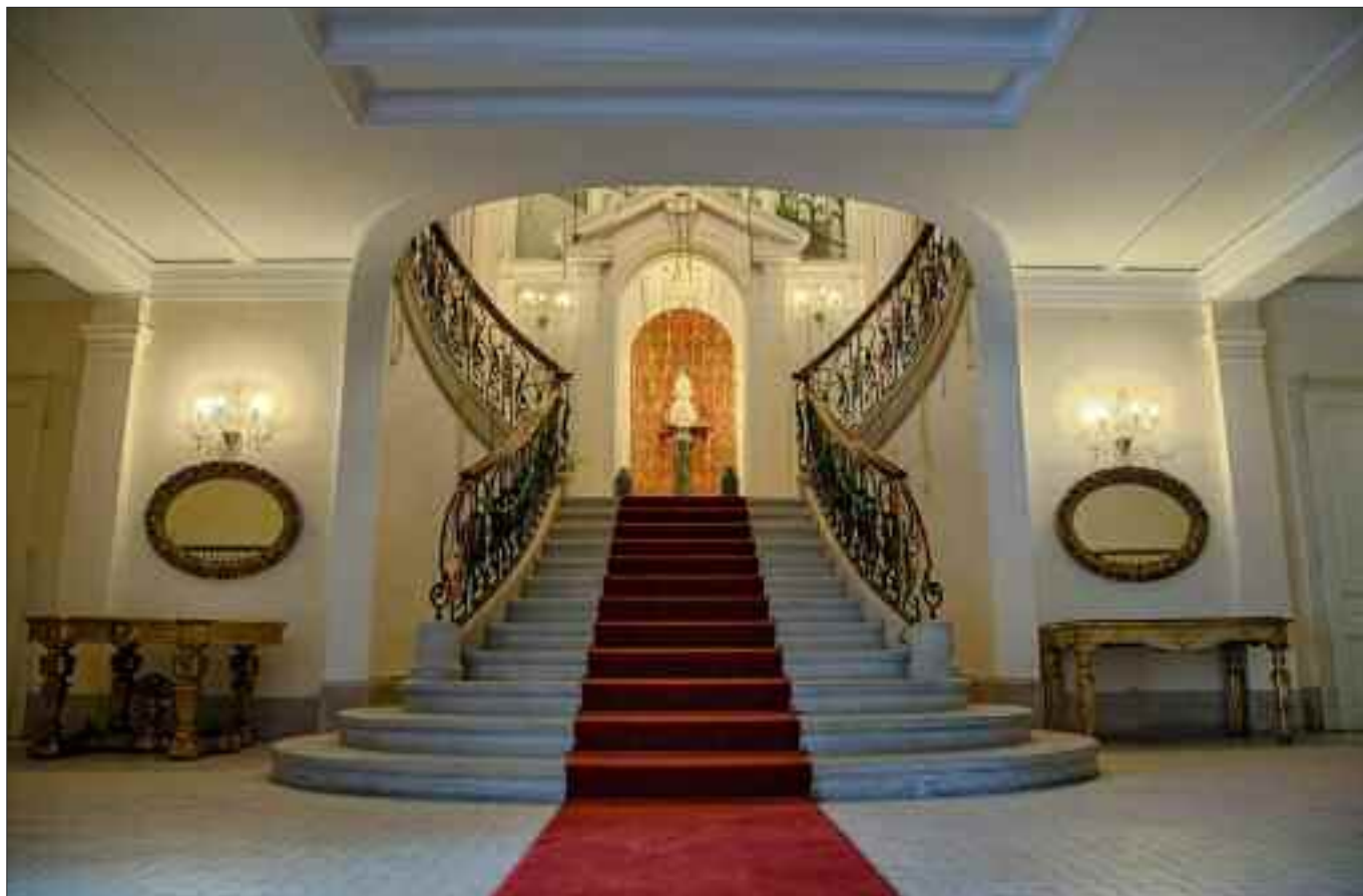
Ingresso del Palazzo.

NEL CENTENARIO DELLA SEDE DIPLOMATICA ITALIANA