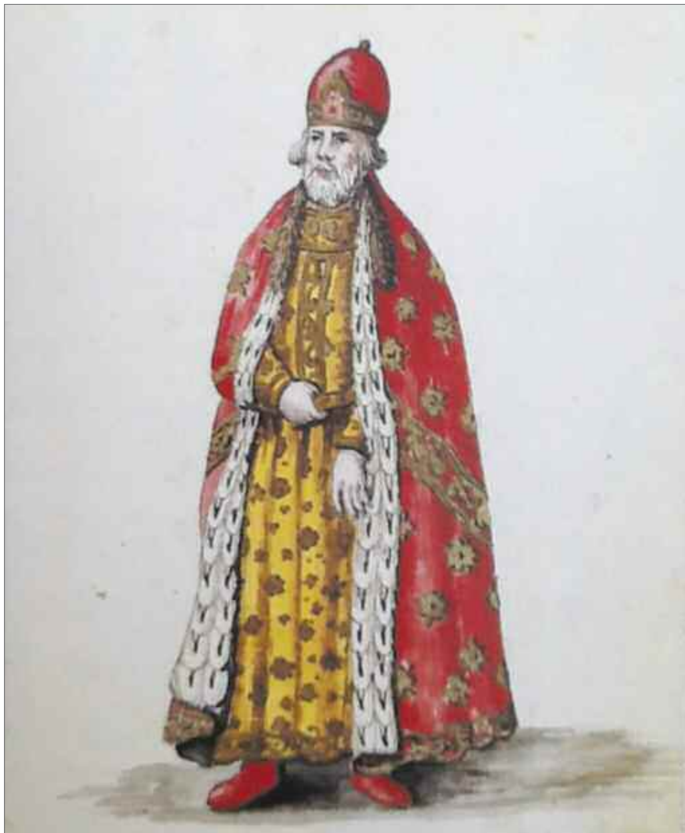
Doge, Sec. XVIII.