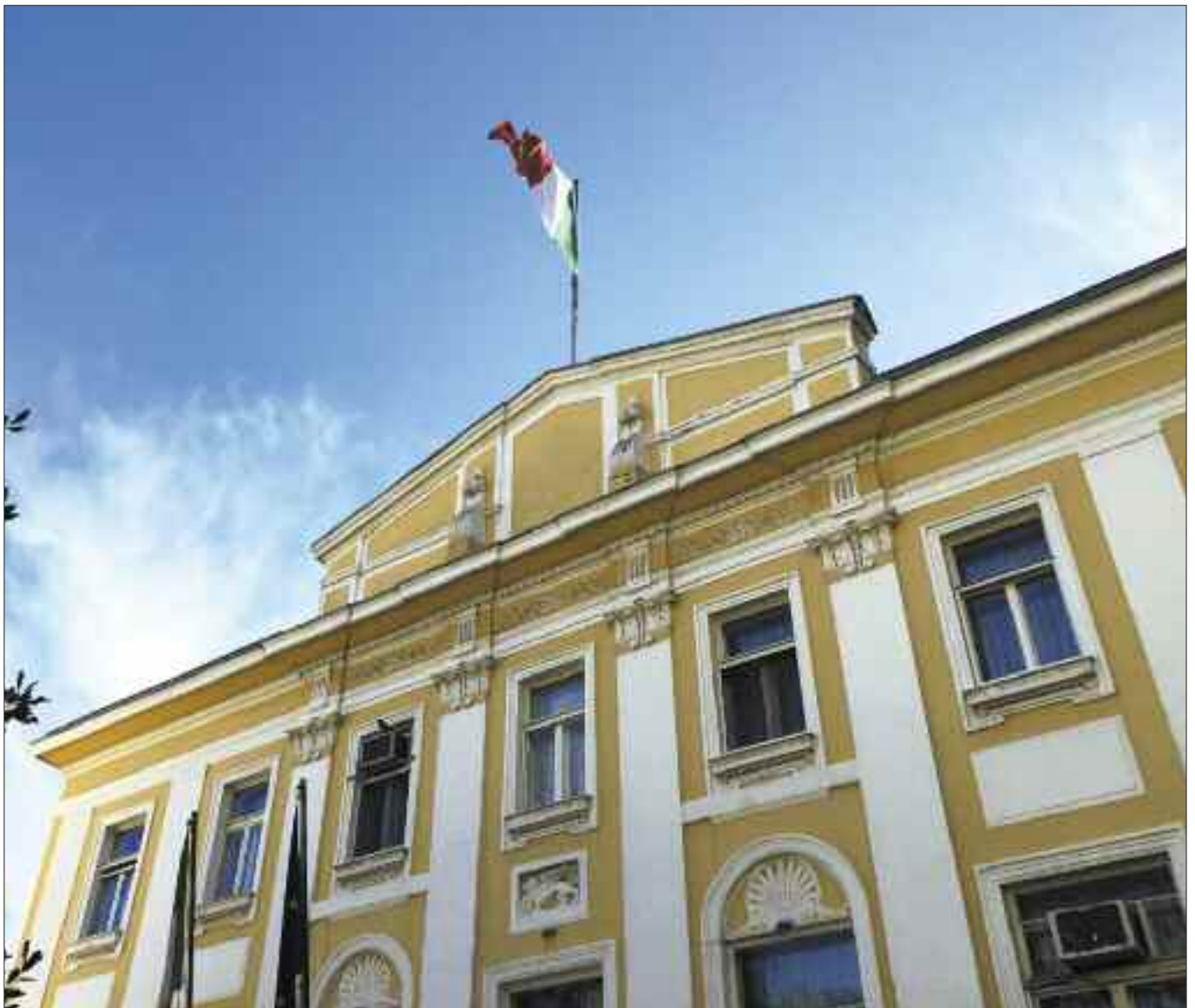
La facciata del Palazzo di Venezia.