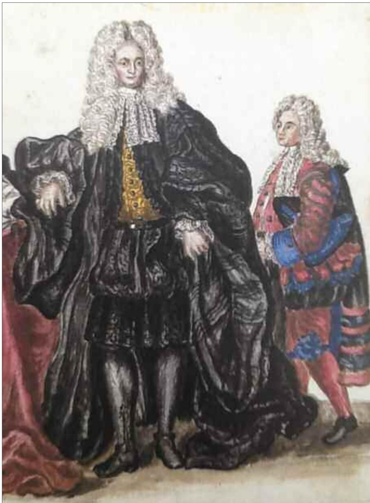
Ambasciatore Veneto, Sec. XVIII.