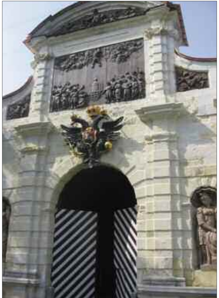
Porta di Pietro I presso la fortezza dei SS. Pietro e Paolo a San Pietroburgo.

Nello stesso periodo l'ICE effettuava anche un'altra opera di restauro architettonico ed artistico nella Federazione Russa, presso la fortezza dei SS. Pietro e Paolo a San Pietroburgo.