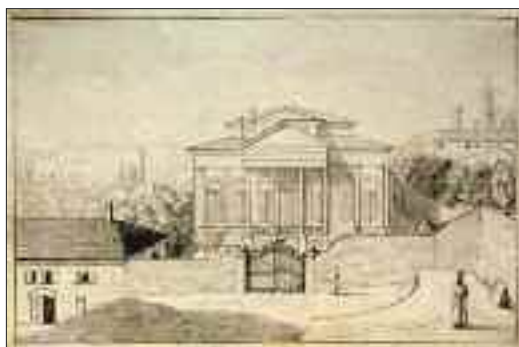
Costantinopoli, Palazzo di Venezia, inizio 700.