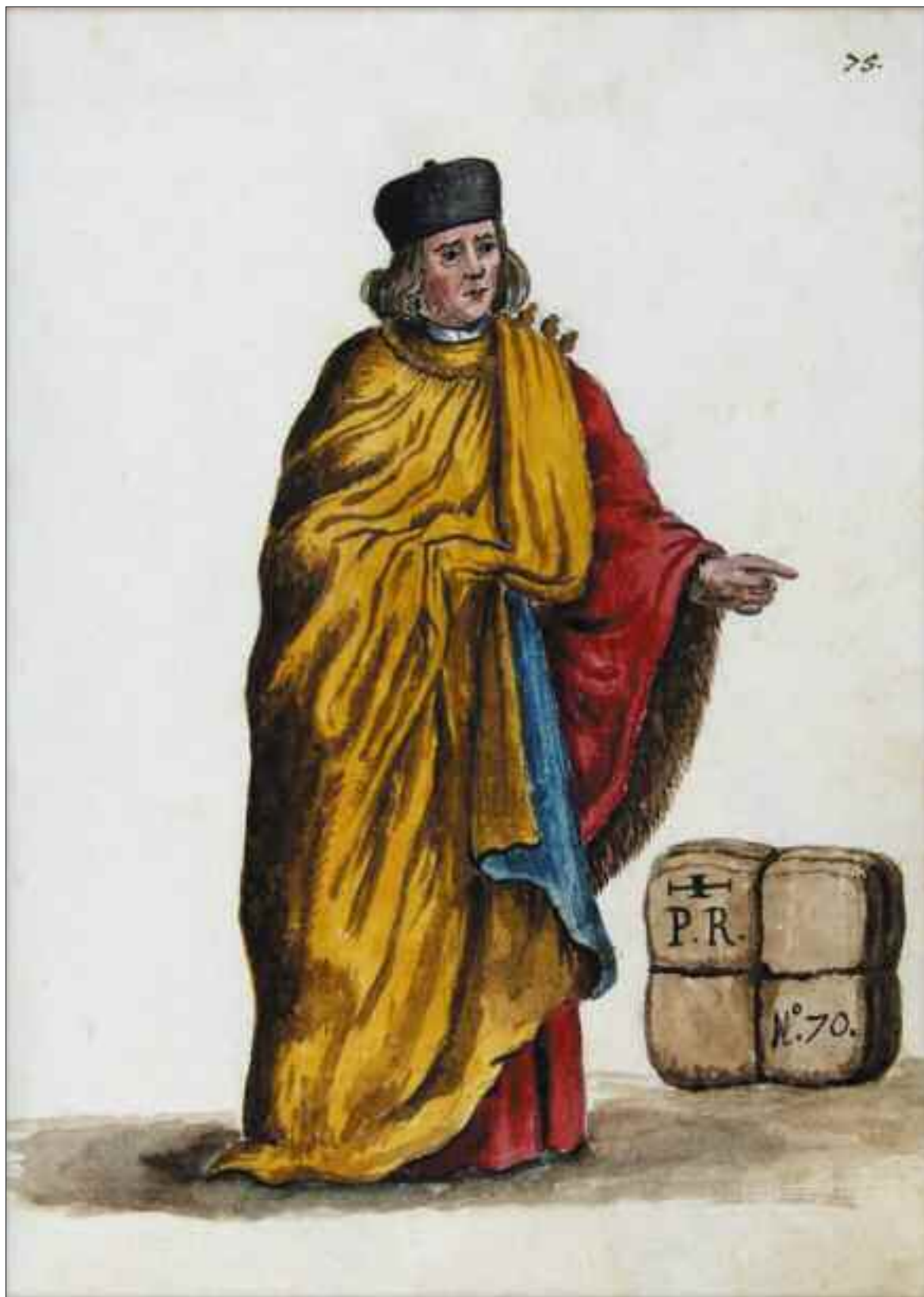
Console a Costantinopoli, Vol. I, tav. 75. G. Grevembroech, Gli abiti de Veneziani, Biblioteca del Museo Correr.