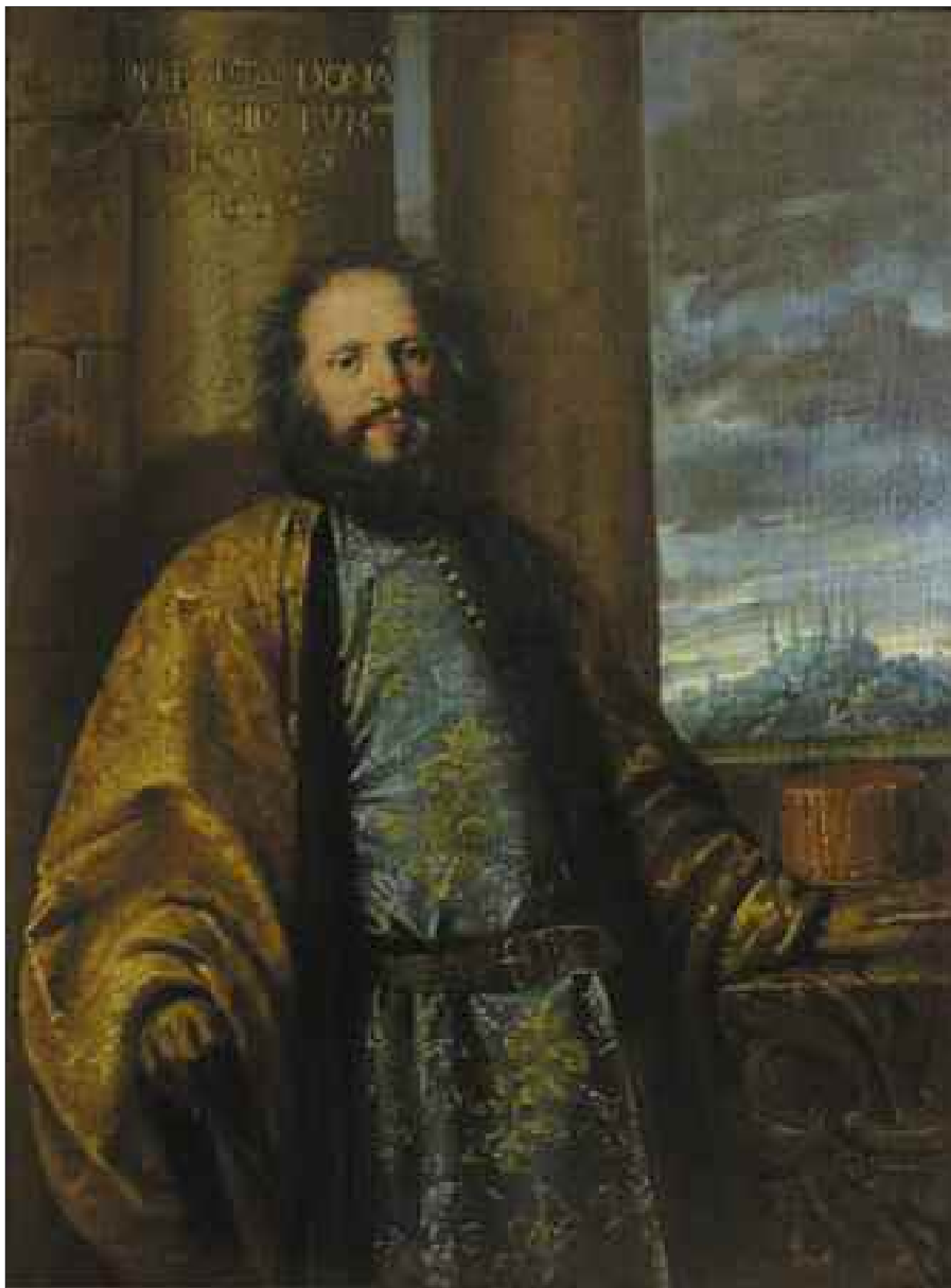
Ritratto di Gianbattista Dona' in veste di Bailo a Costantinopoli. Museo Correr Venezia.