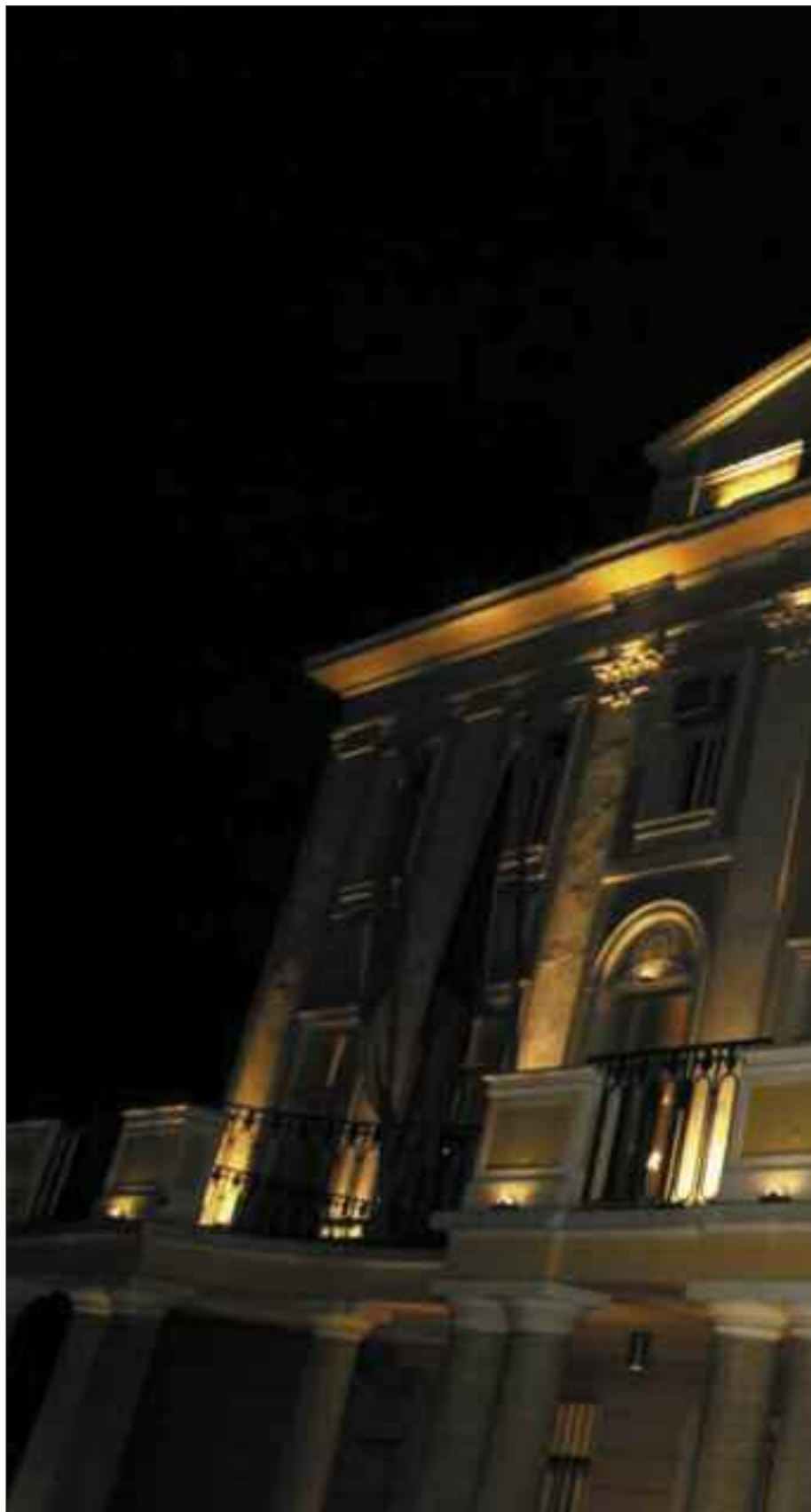
Veduta notturna del Palazzo di Venezia.