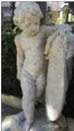
Putti di adornamento della fontana di Palazzo di Venezia a Roma.