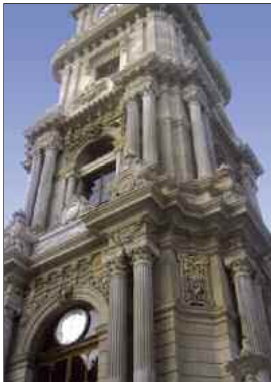
Istanbul. La Torre dell'Orologio.