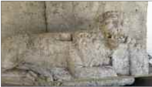
Scultore anonimo. Coppia di leoni di San Marco. Roma, atrio della Basilica di San Marco.