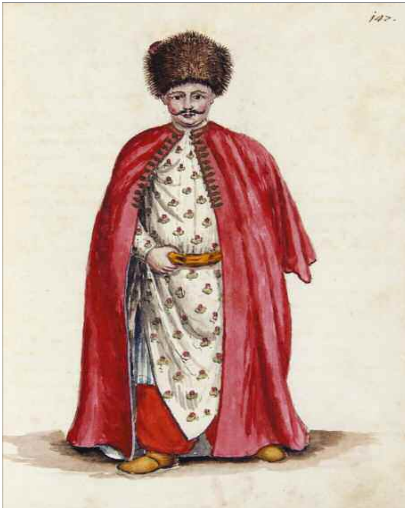
Dragomanno a Costantinopoli, Vol. IV, tav. 147. G. Grevembroech, Gli abiti de Veneziani, Biblioteca del Museo Correr.