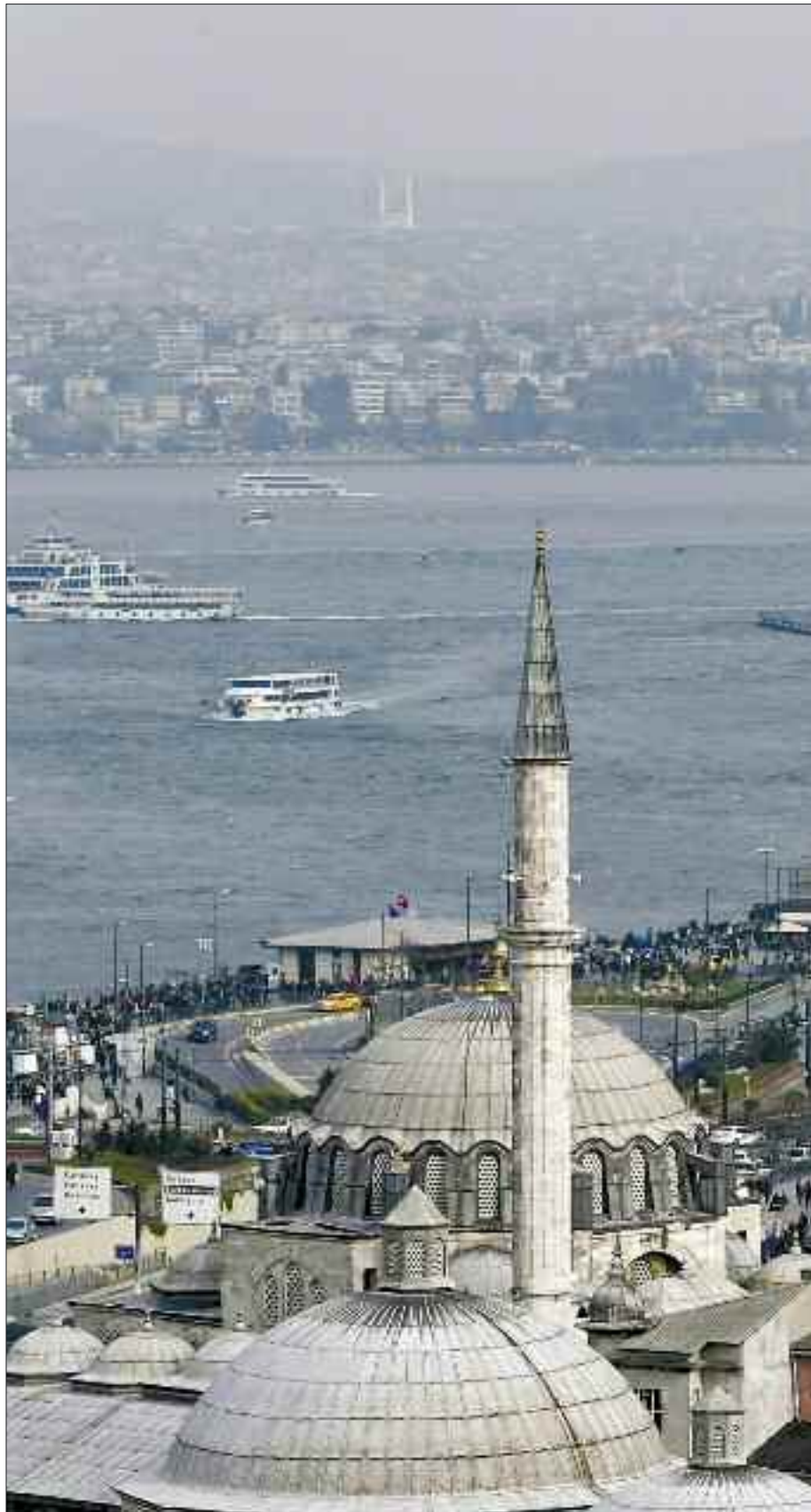
Veduta panoramica di Istanbul.