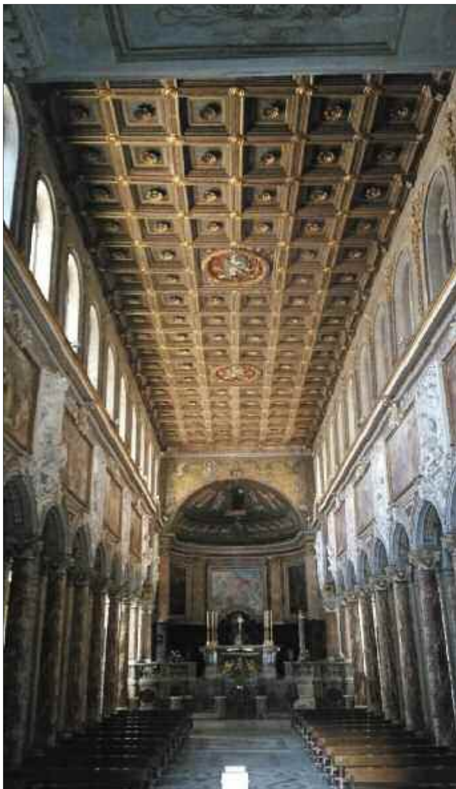
Basilica di San Marco a fianco al Palazzo di Venezia, Roma. Eretta nel sec. IV fu ricostruita nel IX e rinnovata poi nel XV e XVII: la facciata classicheggiante a doppio loggiato è del 1468; appartengono al sec. IX la cripta ed il mosaico bizantineggiante; dipinti di Melozzo da Forlì e tabernacolo di Mino da Fiesole e Giovanni Dalmata; il campanile è romantico.