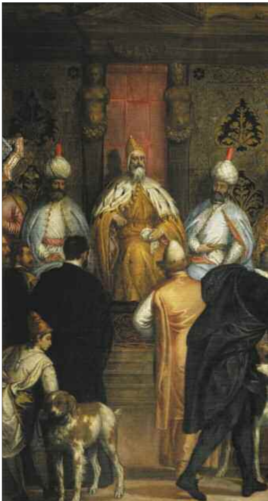
Carletto e Gabriele Caliari, dipinto raffigurante Ambasceria ottomana a Venezia, 1595. Palazzo Ducale. Sala delle Quattro Porte.