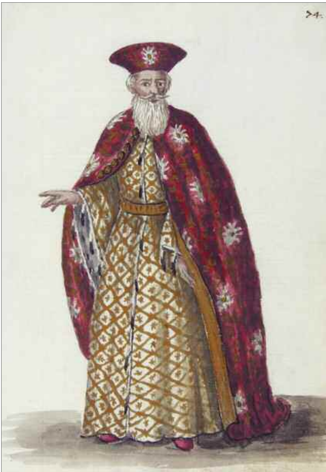
Bailo a Costantinopoli, Vol. IV, tav. 74. G. Grevembroech, Gli abiti de Veneziani , Biblioteca del Museo Correr.